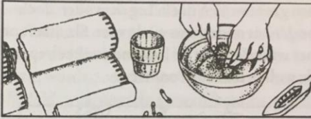
Doorsnijden van de citroen onder water.