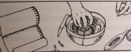
Uitdrukken van de citroen met een glas.