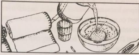
Overgieten van de citroen.