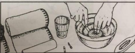
Insnijden van de citroen.